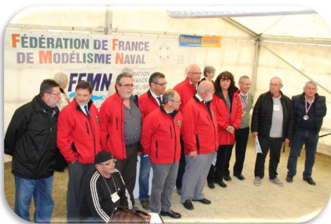
Championnat de France 2018