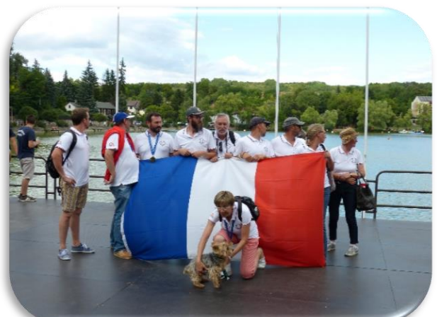
équipe de France 2019