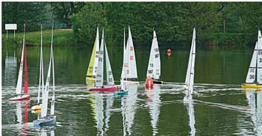
Classe S. Passage de la flotte F5 E de la bouée sous le vent.