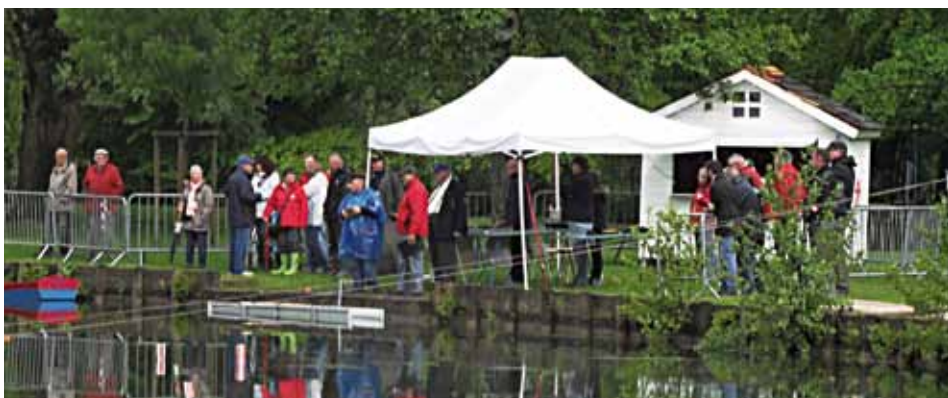
Classe NS. Vue d'ensemble de la zone de pilotage.

Le club MYCP avait en plus organisé une exposition de nombreux modèles de navires en provenance de nombreux clubs pour le plus grand