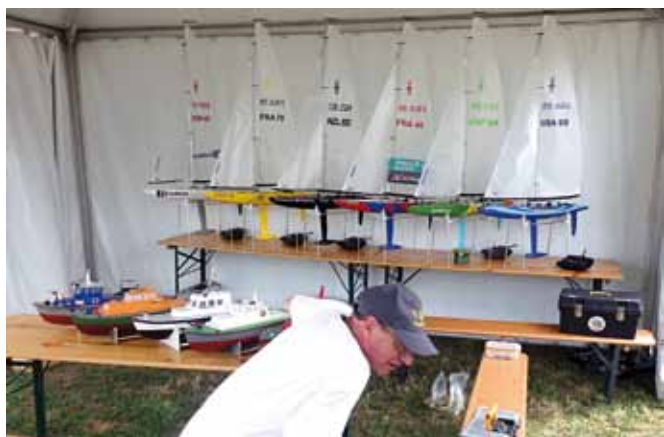
La flotte de l'inter-région Île de France mise à la disposition des enfants en rémission.