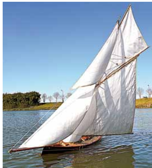
Marigold à l'échelle 1/15.