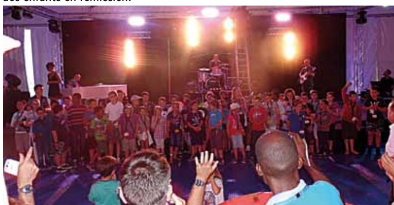
Soirée de gala organisée pour les enfants.