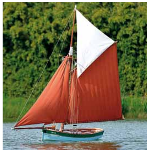
La Ste Jeanne à l'échelle 1/12.