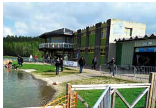
Gros plan sur le Club house de Wingles.

Ne pas oublier qu'un second plan d'eau est réservé pour les pêcheurs. Nous disposons d'un garage commun pour le stockage de nos matériels.