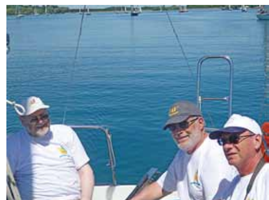
L'équipage FFMN prend le large.