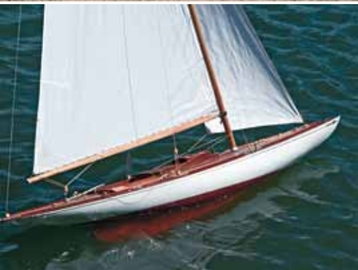
Fulmar à l'échelle 1/15.