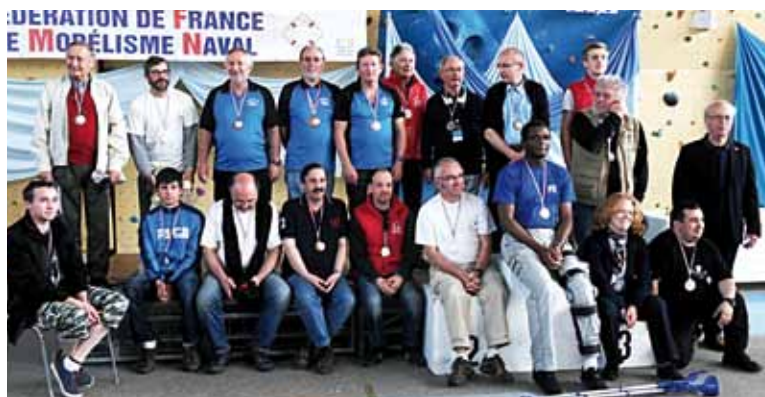
Photo de famille des médaillés des classes NS

Ce magnifique plan d'eau et son infrastructure permettent maintenant d'accueillir des compétitions ainsi que des rassemblements de modélistes de toutes régions. Cette base de loisir est de plus en plus utilisée par les clubs et associations ainsi que par les