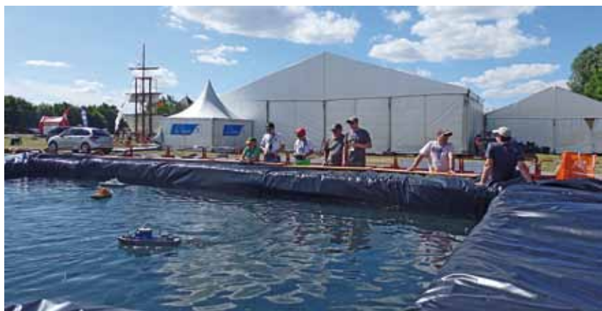
L'écolage version bateaux électriques.