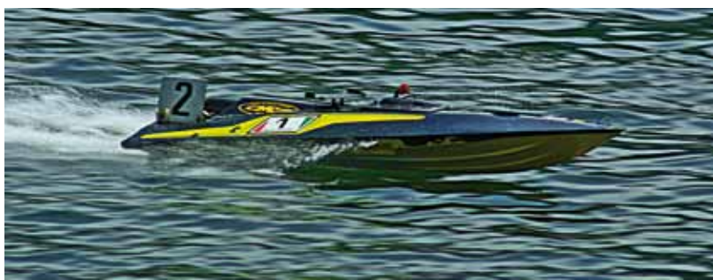
La coque de 7,5 cm 3 de l'Italien Mauro Braghieri, vainqueur dans cette catégorie.

Autre innovation, l'apparition du drapeau bleu