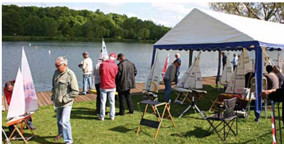
Classe S. Paddock et ponton de mise à l'eau à Damville.