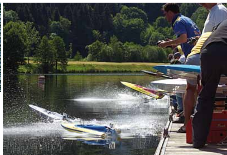
La trompe vient de sonner le départ. La ronde durera 30 mn pour cette finale.

Cette innovation a pour but de ne pas épuisser les arbitres qui, sans cette rotation, passeraient la journée à voir défiler des bateaux qui vont de plus en plus vite et surtout, ayant l'expérience de la course, devraient être capables de prévenir les actes antisportifs qui sont causes de beaucoup