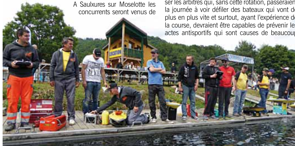
Un ponton solidement amarré de 20 m de long, des forêts alentours, une eau limpide... Quand le soleil illumine tout cela, que demander de plus?

Le plan d'eau se situe dans une vallée dont les pentes sont couvertes de forêts. Le cadre est