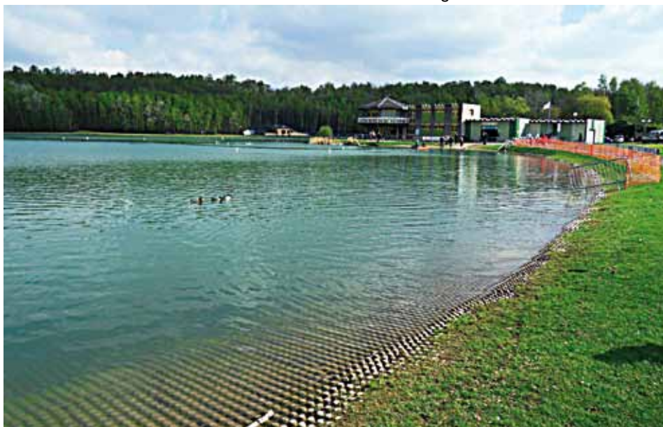
Vue d'ensemble du bassin de la base de loisirs de wingles avec au fond le club house.

(Président du comité de l'interrégionale N/O).