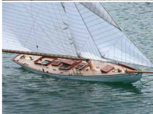
Mariska à l'échelle 1/15.