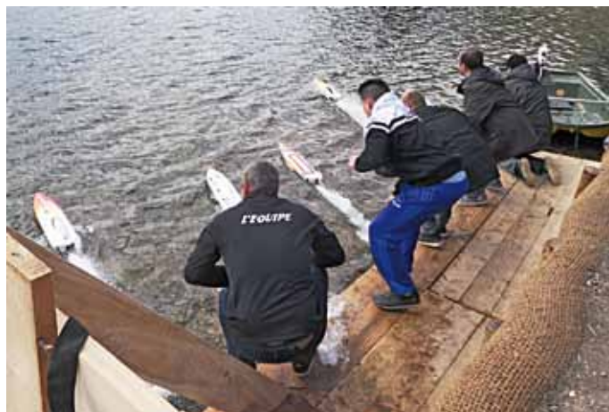
Un départ de course classe M.

Ce plan d'eau appartient à la communauté de commune qui investit pour le plaisir et la détente de tous et des touristes de passage. Le club « EMN » a signé une convention avec la communauté de commune pour l'utilisation de ce plan d'eau à l'année pour pouvoir naviguer et organiser des manifestations.