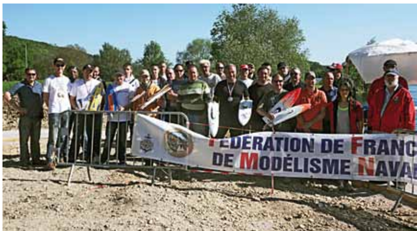
L'ensemble des concurrents de la classe M.