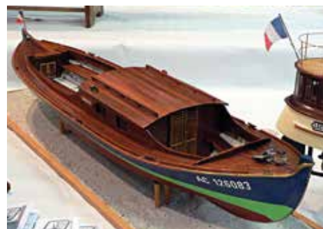
Pinasse bassin Arcachon expo Cestas.

Son économie repose sur : L'agriculture, la viticulture, le tourisme, l'industrie aéronautique et