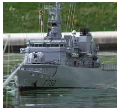
Floréal sur le plan de Pau.