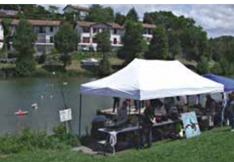
Vue sur le plan d'eau de St Pee.

amène à proposer des manifestations ludiques : expositions, démonstrations sur des plans d'eau ainsi que la participation à la vie périscolaire.