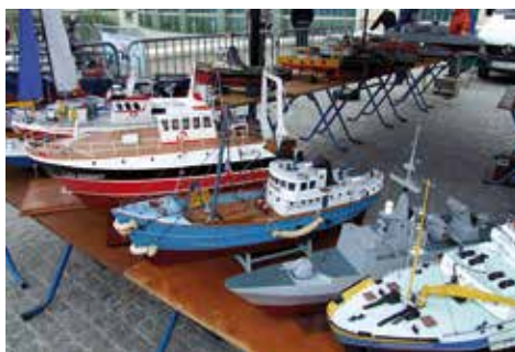
Ensemble modèles lors d'une compétition NS à Pau.