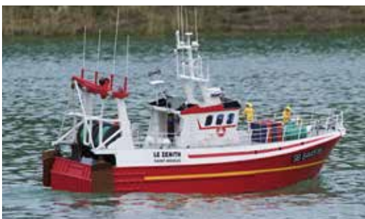
Le Zénith sur le plan d'eau Cestas.