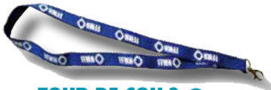
TOUR DE COU 3 € Port inclus