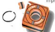
PORTE-CLEFS 3 € Port inclus