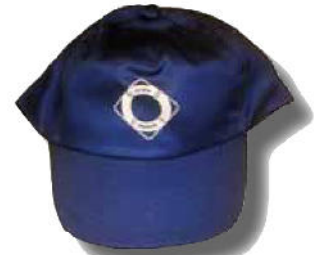
CASQUETTE 5 € Port inclus