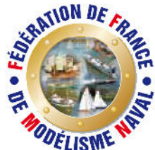
ADHÉSIF 1 € Port inclus