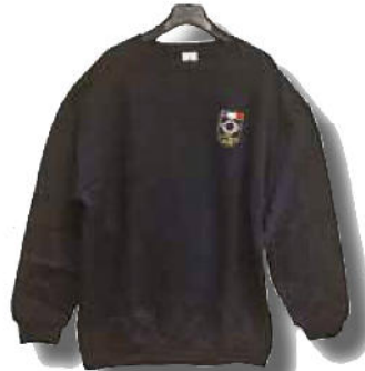
SWEAT-SHIRT 30 € Impression cœur de l'écusson bleu nuit