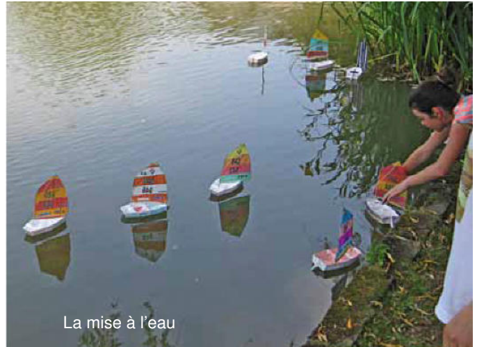
La mise à l'eau

En dehors de l'écolage dans la conduite des voiliers, des bateaux à moteur et des canards (que nous avons créés pour le Téléthon 2013), nous avons incité les enfants à décorer de petits voiliers en DEPRON, que nous avons préalablement