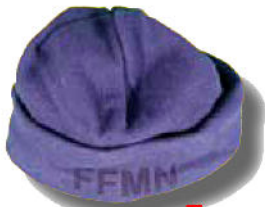
BONNET 10 € Port inclus