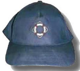
CASQUETTE BRODÉE 9 € Port inclus