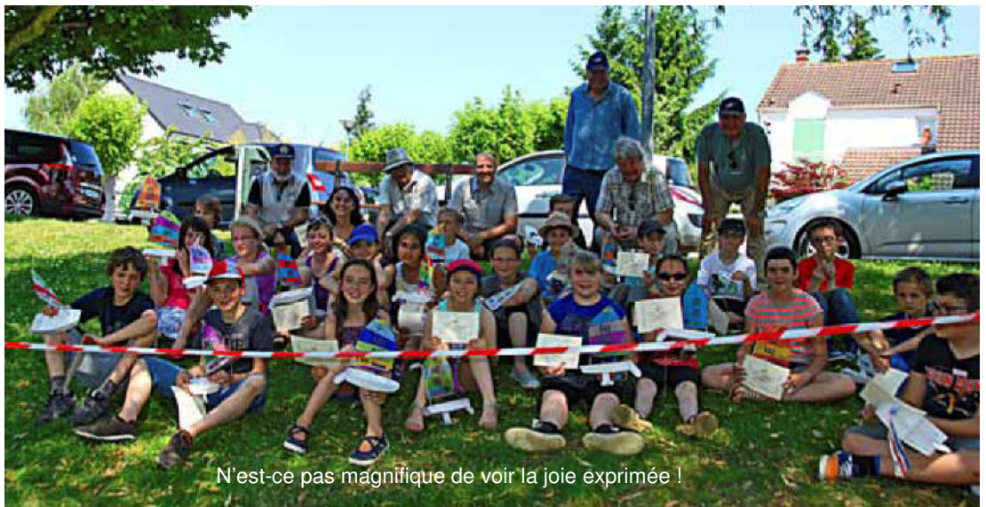
N'est-ce pas magnifique de voir la joie exprimée !