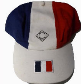
CASQUETTE SUPPORTER 5 €