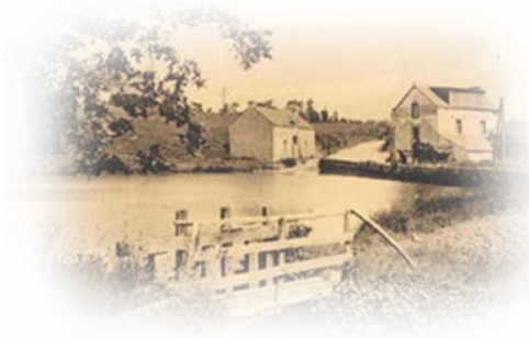
Les Ateliers de Célac